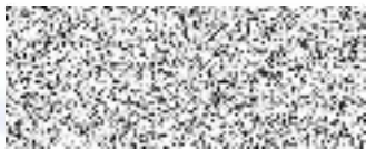
Mgr. Ladislav Chlupáč starosta města Litoměřice